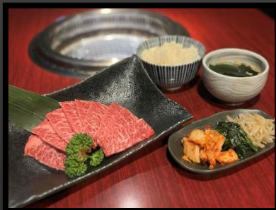
和牛カルビ定食 ¥1800 ライス・キムチ・ナムル・スープ付