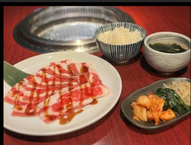
焼きしゃぶ定食 ¥1100 ライス・キムチ・ナムル・スープ付