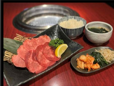
牛タン定食 ¥1600 ライス・キムチ・ナムル・スープ付