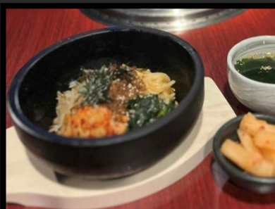
石焼ビンバ定食 ¥850 カクテキ・スープ付