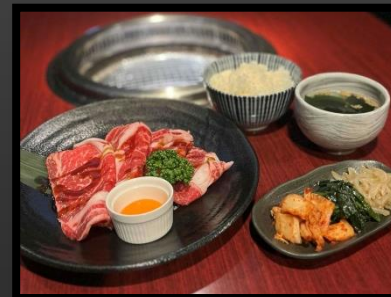
焼きすき定食 ¥2300 ライス・キムチ・ナムル・スープ付