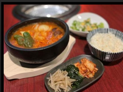
ホルモンチゲ定食 ¥850 ライス・カクテキ・ナムル・サラダ付